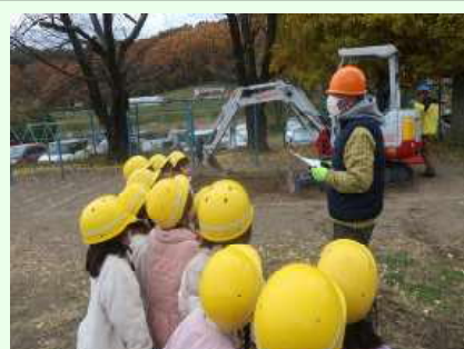
バックホーを見て乗って 商工会建設部会