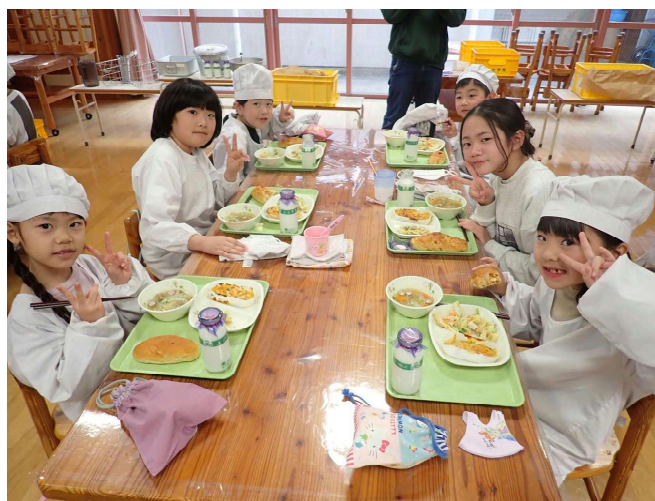
なかよし給食 「いつも楽しく遊んでくれる6年生と一緒に」