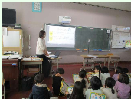
自分の理想の間取りを考えた 里山