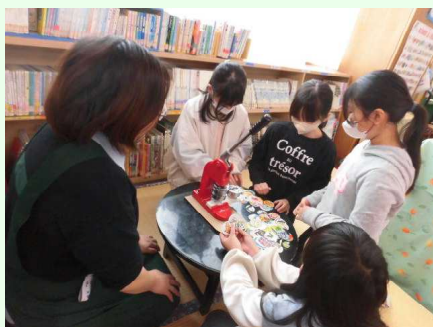
図書館の裏側を教えてもらった 青木図書館