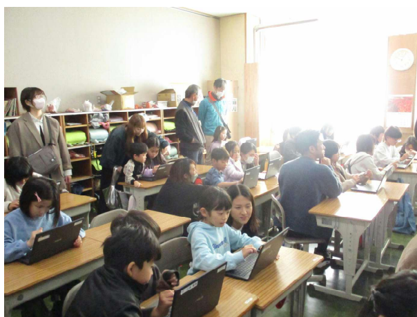
授業参観 「おうちの人と一緒にタブレット学習」