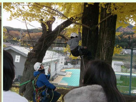
ツリークライミングで高さを感じた 塚田造園