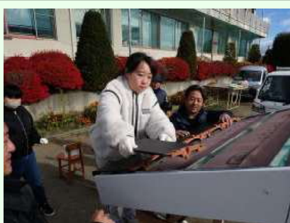
実際に瓦を置いてみた 屋根瓦 イコタ