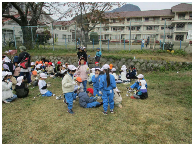
焼きいも交流(年長さんと) 「ほくほくのおいもおいし〜い」