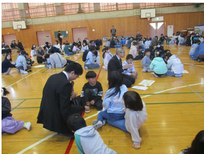
人権講演会 「思い込みと決めつけが差別につながるね」