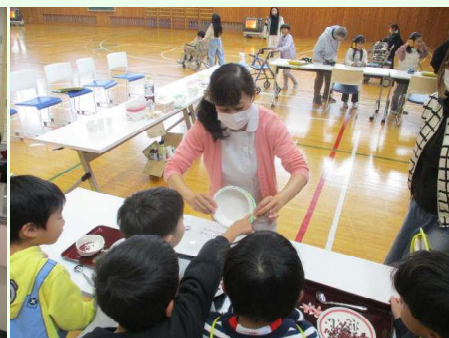
体の不自由さを体験 レポートあおき