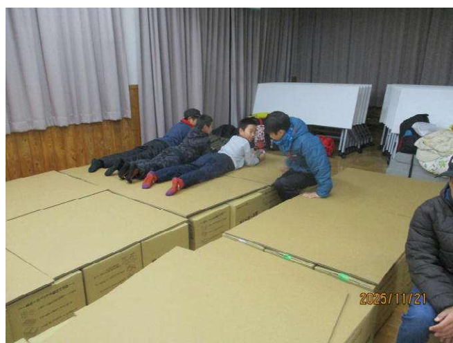
防災合宿 「ダンボールベット広くて3人で寝られそう」