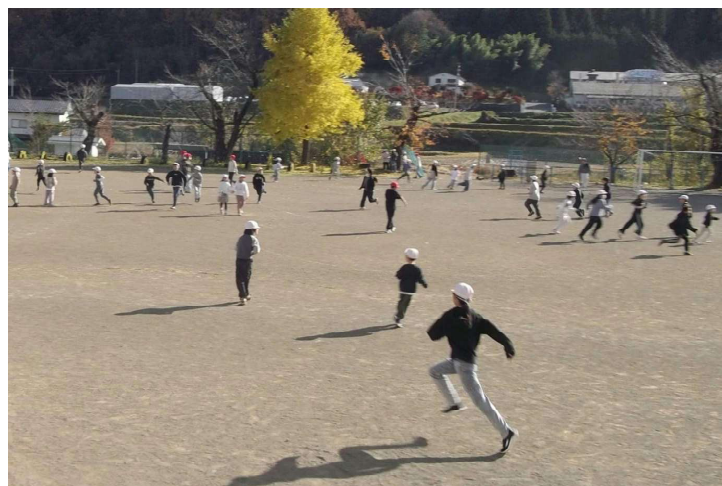
全校鬼ごっこ 「鬼が来た〜逃げろ〜」