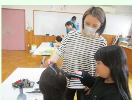
実際に髪を切ったり、編んだり 片田美容室