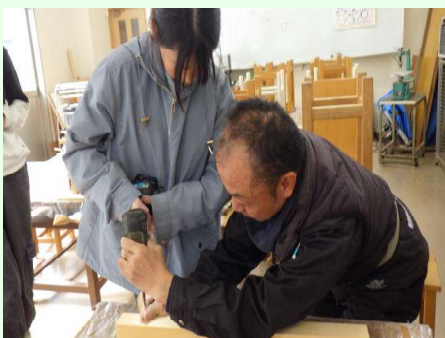
檜を使った小物入れを作った 建築 なお