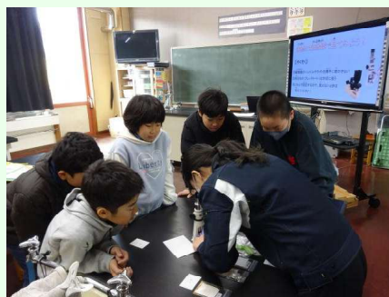
顕微鏡でミクロの世界を教えてもらった 日本光器製作所