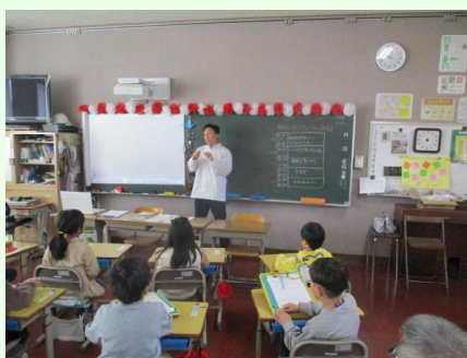
春巻きの巻き方教えてもらった 沓掛冷食