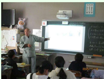
旅館のおもてなしを知る 富士屋ホテル