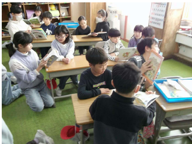
なかよし読書 「ペアで読み聞かせうれしいなあ」