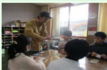
自分で削ってバターナイフ okaikosan

11月18日(火)に青木小学校で初めての試み「夢の種まきお仕事ゼミ」を開催しました。村内の17の企業・事業所の皆さんに協力していただきました。自分たちのお仕事はどんなことをしているか紹介していただいたり、作業を体験させていただいたりしました。子どもたちは、40分ずつ3つのお仕事について学習しました。事業所のみなさんには自分のお仕事の魅力や、やりがい、大切にしていることなどを伝えていただきました。子どもたちはどの講座でも目を輝かせて話を聞いたり、体験したりしていました。普段の教室の中では味わうことのできない、プロのお仕事を感ぜられ、また、一人一人にとって夢の種をまけた半日でした。ご協力いただいた皆様本当にありがとうございました。