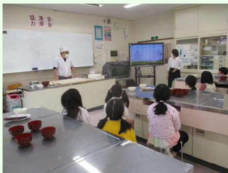
そば打ちを見て食べ比べも 蕎麦屋やまさん