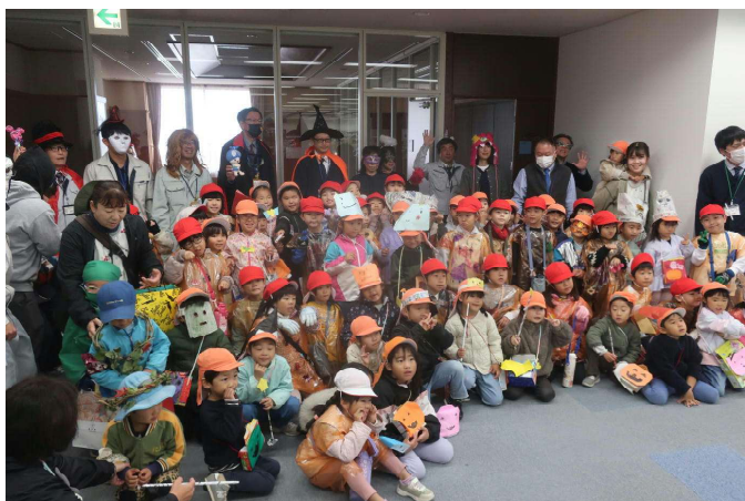
来入児と1年生のハロウィン交流 「お菓子がいっぱいもらえたよ。」