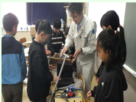
実際の道具や工具を見て触った キャステク