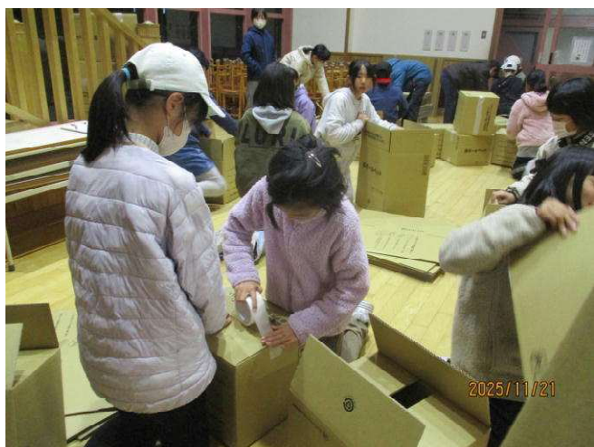
防災合宿 「段ボールベット制作中、自分の寝る場所確保」