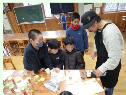
オリジナルコーラを作った よしとも