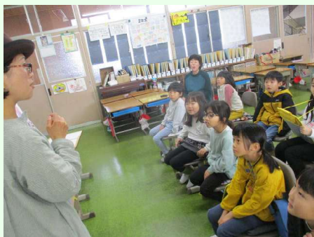
自分の健康チェックを教わった 青木望診所